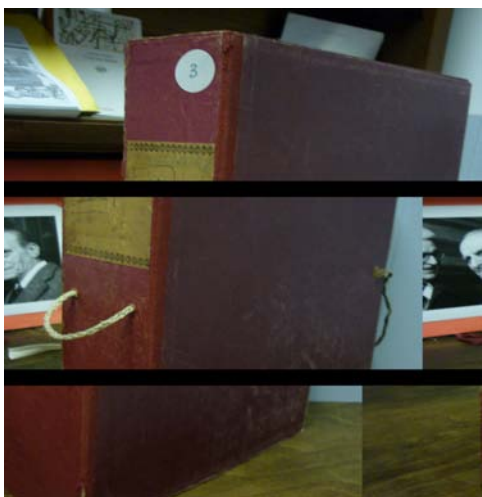
fig.8 – Scatola rossa chiusa con lacci

La documentazione era per la maggior parte contenuta in fascicoli con titoli manoscritti e in minima parte sciolta e appoggiata sulle diverse scrivanie delle stanze. I fascicoli erano collocati in parte in scatole rosse chiuse con lacci (fig.8), con etichetta manoscritta sul dorso, in faldoni chiusi con bottoni metallici, in parte su scaffali, sopra e accanto ai libri (fig.9) e in contenitori appesi a una struttura girevole, denominata Rotor, nello studio (figg.10-11).