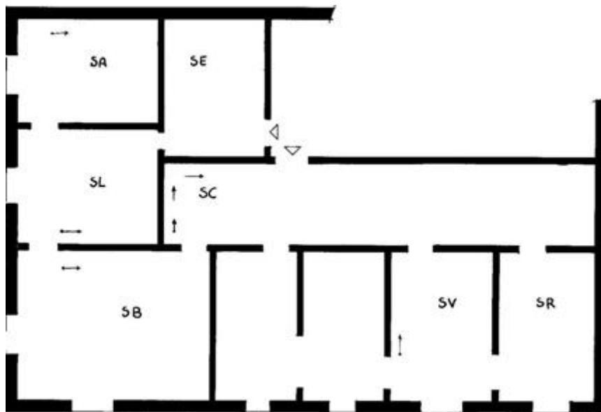
fig.1 – Pianta dell'appartamento