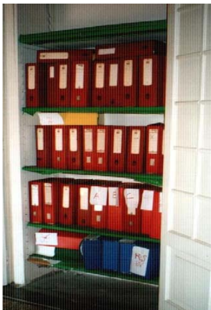
fig.7 – Stanza Epistolario

Per le caratteristiche archivistiche specifiche di ciascuna Stanza si rimanda alla descrizione presente in inventario e nelle schede informatizzate (nel campo Contenuto).