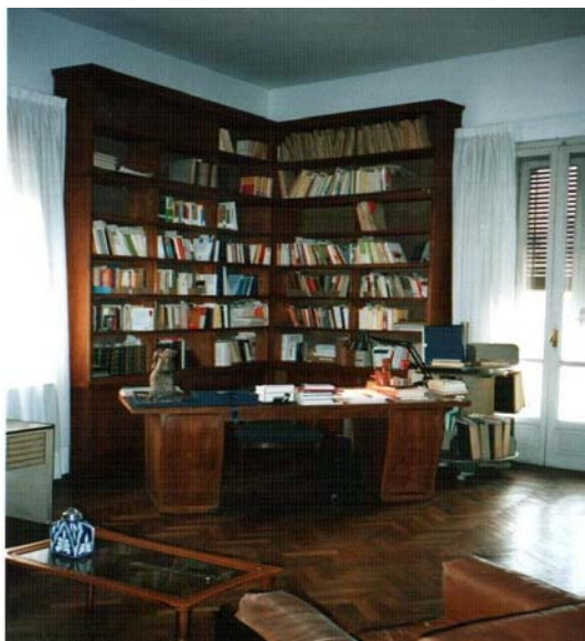
fig.2 – Stanza Studio Bobbio