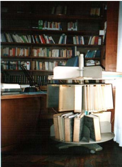
fig.10 – Studio Bobbio, Rotor