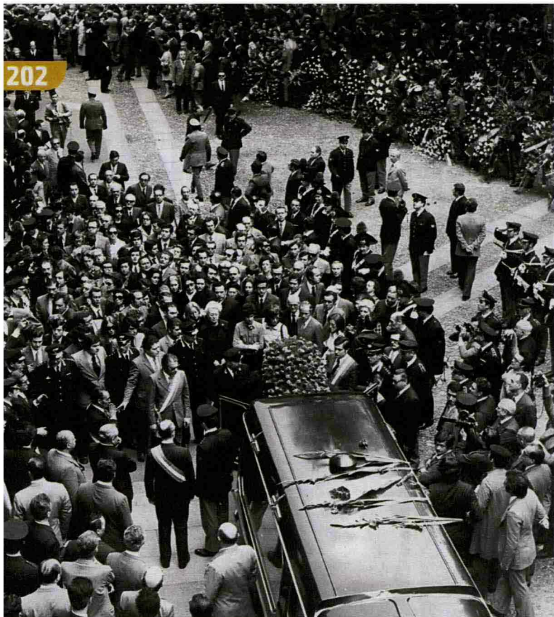
20 maggio 1972: i funerali solenni del commissario Luigi Calabresi, a Milano.