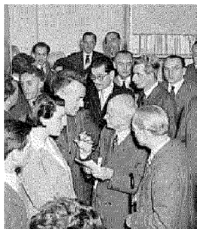
LA REDAZIONE Bobbio e Einaudi nella redazione della casa editrice di Torino