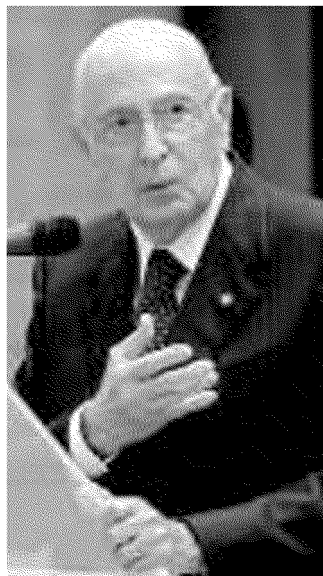
Il Presidente Giorgio Napolitano e nella foto a destra il filosofo Norberto Bobbio